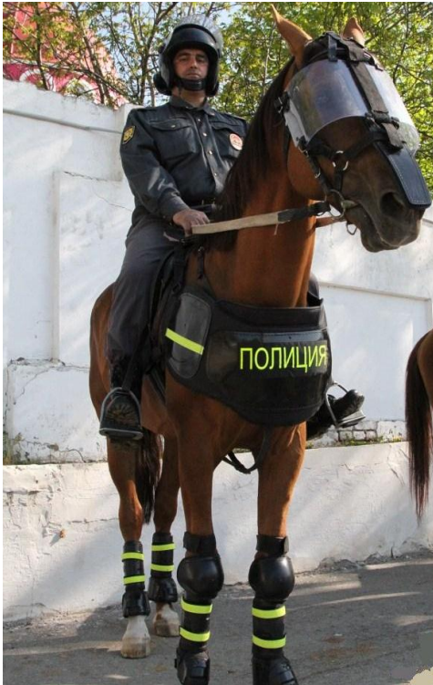
Foto 4. Tänapäeva Venemaa politseihobune ja ratsapolitseinik märulivarustuses (Наша профессия 2012).

katavad ka hobuse põlve, visiirist silmadel ning rinna ja tagaosa kattest, tavapärasel patrullitöös sellist varustust ei kasutata. Igapäevaselt patrullivad ratsapolitseinikud paarikaupa parkides, väljakutel või rannas, kus on palju inimesi ning muudes kohtades, kus on teistel politseiüksustel liikumine raskendatud. (Гусakov 2010)