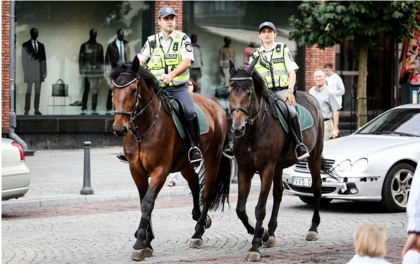
Foto 6. Vilniuse ratsapatrull 2013. aastal.

Autor analüüsidest saadud informatsiooni jõudis järeldusele, et ratsapatrulle on efektiivne kasutada suurtel maaaladel ja kohtades, kus on näiteks autoga liiklemine keelatud. Leedus kasutatakse ratsapatrulle haljasaladel patrullimiseks, sest nad on keskkonnasõbralikud ja ei tekita häirivat müra. Samuti on tähtis politseihobuse heaolu ja sellepärast on kehtestatud patrullis töötamiseks kindlad reeglid.