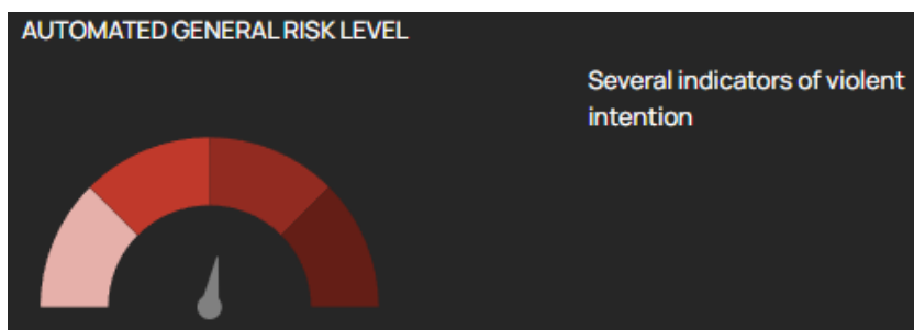
Kuvatõmmis 1. Üleslaaditud tekstis on vägivaldse kavatsuse näitajaid palju

Baghdadi kõne puhul on automaatselt genereeritud punktimäär 59 ehk tekstis on mitmed vägivaldse kavatsuse näitajad (vt kuvatõmmis 1). Dechefer tuvastas potentsiaalse vägivaldse käitumise indikaatoritena järgmised tunnused: viha, ülekohtu tajumine, teisestamine, lekitamine, sõjaväelase mentaliteet / sõjaväeline terminoloogia, kinnisidee, keeleline mõju. Puuduvad indikaatorid: samastumine eelnevate ründajatega.