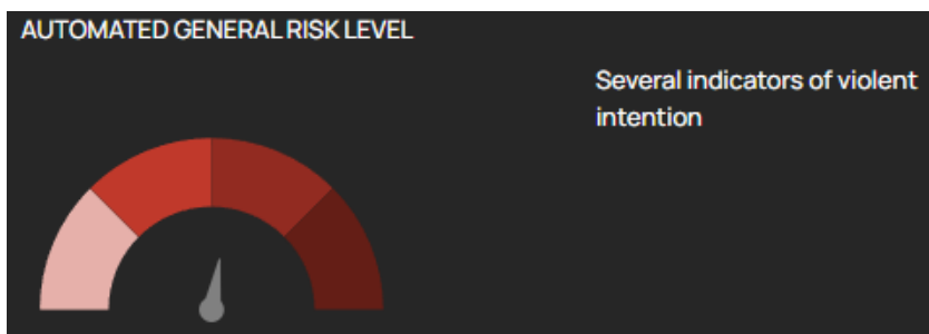
Kuvatõmmis 3. Sotsiaalsuse parameetrid – enesekeskus, teisestamine, ühtekuuluvus ja grupikesksus – üles laaditud tekstis võrdluses normaalvalimiga

Inimese mina-kontseptsiooni olulise osa kujundavad suhted teistega. Kuuluvustunne on inimese üks põhivajadusi ning seetõttu on grupikuuluvus ja sotsiaalse identiteedi kontseptsioon olulised komponendid, mis aitavad selgitada indiviidi tegude motivatsiooni. Mitmuse kolmanda isiku (nemad) tihe kasutamine – osa teisestamisest – on usaldusväärne indikaator kuuluvustundest grupiga, kelle identiteedi alus on vastandumine negatiivsele välisele grupile (ingl out-group ). Viimast võib pidada konflikti ja mõnikord ka äärmusliku käitumise ettekuulutajaks. Ühtekuuluvuse madal punktimäär näitab sotsiaalset isolatsiooni. Tööriista järgi peegeldab ainsuse esimese isiku (mina) sagedane kasutamine enesekeskust, samas kui mitmuse esimese isiku (meie) kasutamine on märk grupikesksusest. Vt kuvatõmmis 3.