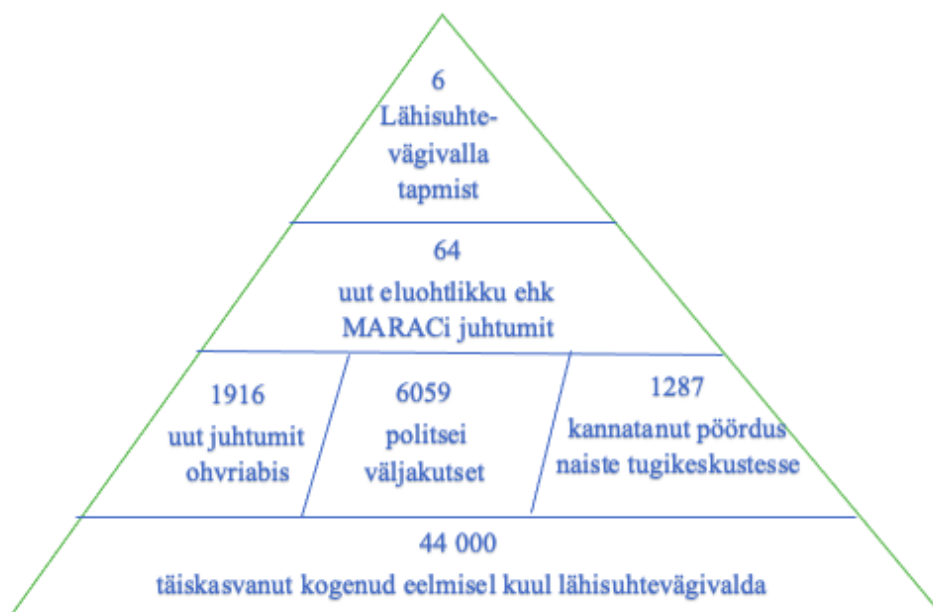
Joonis 3. Lähisuhtevägivalda püramiid jaanuar – juuni 2020. (Sotsiaalkindlustusamet, 2020: autori koostatud)

Perevägivallast teatavad üha enam politseile just kolmandad isikud, mitte ohvrid ise ning tavaliselt on nendeks naabrid või lapsed. Küsides vägivalda ohvrilt, miks ta nii kaua nõustus elama terrori all ega midagi ette võtnud, on tavaliselt vastuseks lootus, et elukaaslane muutub ning samuti on hirm alanduse ja nõrkuse välja näitamise ees. (Ellermaa, 2019) Kõrvalseisjale, kes pole ise vägivalda kogenud, võib tunduda arusaamatu, miks ohver lihtsalt ei lahku vägivaldse partneri juurest, kuid tegelikult on see oluliselt keerulisem. (Linno, 2011) Ohvrid süüdistatakse ka, et nad on ise juhtunud ise süüdi ning võiksid lahkuda, kui ei meeldi. Ohvrit tuleb mõista ning saada aru, et elukaaslase juurest lahkumine toob endaga kaasa suuremaid kaotusi, kui ainult kaaslane. Seotud on ka lapsed, ühine kodu ning muud materiaalsed asjad, mis inimesi seovad. Lähisuhtevägivalda infoteadetest suur osa ei jõuagi kriminaalmenetluseni. Menetlejate sõnul objektiivsete hinnangute tõttu. (Tamm, et al. , 2018) Lähisuhtevägivalda ohvrina on oluline oma vigastused dokumenteerida traumapunktis või politseis, sest hiljem kohtuprotsessis on need oluliseks tõendusmaterjaliks (Politsei- ja Piirivalveamet, 2022).