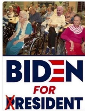
Joonis 5. Ameerika presidendikandidaat Joe Bidenit pilav meem (Spiering, 2020)

Ühildades jamming`u (kui kommunikatsioonitehnika) ja lisades sellele poliitilise eesmärgi, saame political jamming`u , kui diskursuse muutmise/kaaperdamise poliitsfääris, mis kasutab tarbijale tuntud konteksti, mõjutamaks emotsionaalselt laetud alltekstiga tarbija seniseid arvamusi ja vaateid. Väga oskuslikult kasutas political jamming`ut rahvusvahelisele poliitikale (sealhulgas retoorika) kujundamisel Ameerika president Donald Trump. 2019. aastal tegi Trump Twitteris 7700 postitust, millest kaks kolmandikku promosid teda ennast ja tema administratsiooni ning üks kolmandik ründas tema poliitilisi konkurente või kriitikuid (Anspach, 2020, p. 2). Trump kasutab otsekohest “macho” retoorikat, mis on traditsiooniliselt ettevaatliku poliitilise keelekasutusega kõrvutades silmatorkav, meeldejääv ning meelelahutuslik. Samuti levitab Trump oma Twitteri konto vahendusel meeme ja videosid, mis promovad teda või naeruvääristavad konkurente.