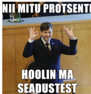
Joonis 3. Meem, mille aluseks on Martin Helme näidatud käemärk (Poliitilised Meemid, 2019)