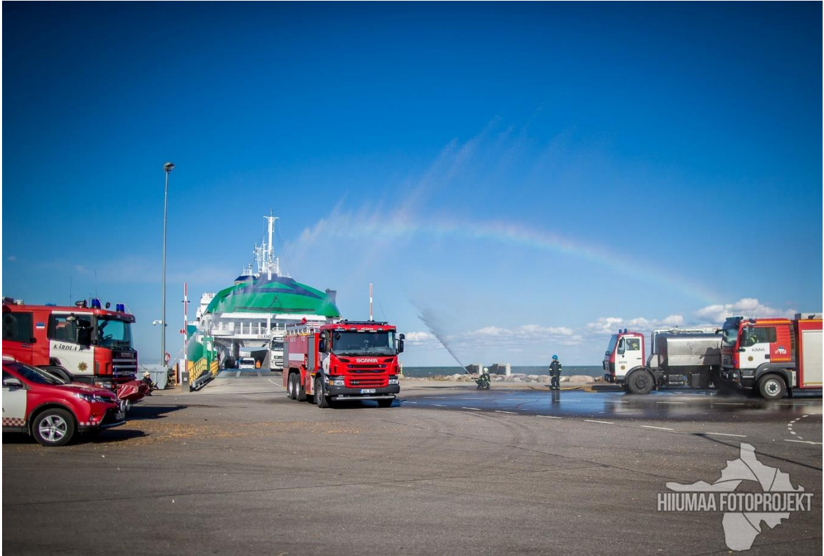
Uute paakautode vastuvõtt Heltermaa sadamas.