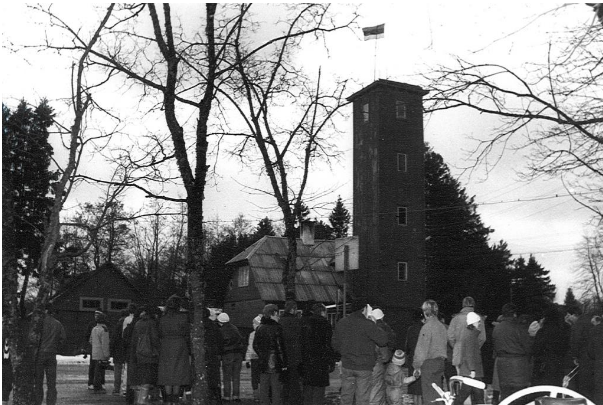
Lipu heiskamine pritsimaja torni 24.02.1989.

Isegi tänaseni on säilinud ühingul kohustus pidupäevadel Eesti Vabariigi lipp torni heisata.