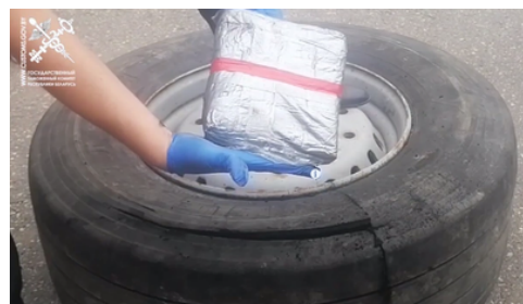
Valgevene toll: Fototabel, avastatud narkootikumid