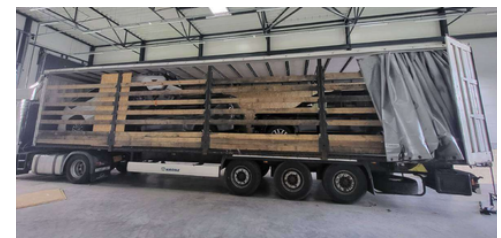
Toyota LandCruiser maasturite transport poolhaagisil

Leedu toll pidas 10.08.2024 Medininkai piiripunktis kinni Valgevenesse suunduva veoauto koos poolhaagisega, mille teekonna lõpp-punktiks oli deklareeritud Usbekistan. Dokumentide järgi vedas Usbekistani kodanikust veoautojuht koormas 720 kg tualettpaberit. Leedu tollitõotajad teostasid veoki röntgenuuringu jaa kontrolli. Läbivaatusega tuvastati, et poolhaagisessse olid laotud tualettpaberit kastid, mille küljed olid kaetud puitleastplaadidega, mille taha oli peidetud 3 Toyota LandCruiser maasturit.