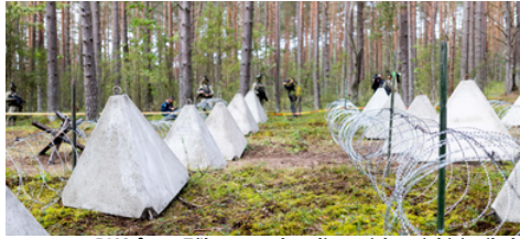
Tõkestusvahendite esitus ajakirjanikele

Leedu kaitseminister Laurynas Kasčiūnas teatas 07.08.2024, et Kaliningradi oblasti piiri lähedale rajatakse 2 kohta kindlustusi ja aeglustustõkkeid, kuhu paigaldatakse tõketena "draakoni hambad", teetõkkeid ja "siidid". Leedu kaitseministeerium esitles 22.08.2024 selleks meediale piirile paigaldatavaid tõkestus- ja aeglustavahendeid. Ametlikult tutvustatakse Kaliningradi piiril kindlustuste rajamisega seotud otsused avalikkusele 05.09.2024. Esialgse info kohaselt eraldati kindlustuste rajamise meetmeteks üle 4 miljoni euro. Kolme aasta jooksul kavandatakse selleks eraldada 17,5 miljonit eurot. Leedu kaitseministeeriumi hinnangul võidakse selleks vajada 10.aasta jooksul umbes 600 miljonit eurot. Leedu teatas varem ka muudest piirikaitsme meetmetest, milleks on maaparanduskraavide süvendamine, puude alleede rajamine teede äärde, metsaaladel raiete piiramine kuni 20 kilomeetri kaugusel piirist ning põhimaanteede ümbruses.