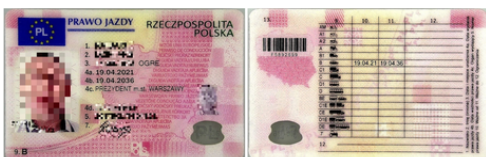
Täielikult võltsitud Poola juhiluba

Leedu piirivalvurid pidasid kinni 11 Ukraina kodaniku, kes organiseeritult transportisid ja julgestasid Schengeni alal teise rände ilminguna kokku 79 ebaseadusliku sisserändajate transporti. Leedu piirivalvurid pidasid augustis 2024 kinni 7 võltsitud dokumeti, millest 2 olid täielikult võltsitud Poola juhiloa, 1 fantaasia dokument -Nigeeria juhiluba, ja 1 täielikult võltsitud Albaania juhiluba ja 1 Moldova juhiluba, 1 täielikult võltsitud Itaalia sõiduki registreerimistunnistus ning 1 võltsitud Hispaania sõiduki registreerimistunnistus.