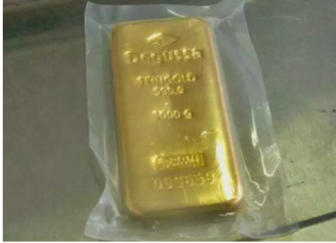
1000g kullakang.

Pihkva tolli avaldas 26.08.2024 teatel, et kinni peeti 58-aastane Saksamaa kodanik , kellelt leiti piiriületusel 13 kg kulda. Isik ei deklareerinud piiripunktis mitte midagi peale matkaauto, millega ta reisib. Kullakangid markeeringuga "Degussa FEINGOLD 999,9" kaaluga 1g-1000g avastati matkaauto skaneerigu tulemusena, osad kangid leiti isiku pagasit kontrollides. Avastatud kullapartii kogumaksumus on esialgsel hinnangul 90 miljonit rubla (a'la ~ 900000 eurot). Kulla salakaubaveo katse eest algutati Venemaa kriminaalasi ja rikkujat ähvardab kuni viieaastane vangistus ja rahatrahv kuni 1 miljon rubla. Mõnede allikate põhjal paigutati Saksmaa kodanik kinnipidamise asemel hoopis koduaresti. Tegemist on juhtumiga, kus avaldatakse piiratud kujul vastuolulist infot . Avaldatud teates puudub piiripunkti nimi, kust kullapartii leiti. Eesti toll ei kinnita kulla salakaubaveo juhtumit.