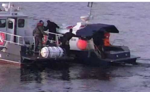
Poide eemaldamine

Eesti välisministerium tegi juuli keskpaigas Venemaale ettepaneku Narva jõe põhja ühiseks mõõtmiseks , et lahendada erimeelsus , kus peakis paiknema jõe laevateed tähistavad poid. Venemaa seadis oma vastuses faarvaatri ühise mõõtmise arutamise eeltingimuseks piirilepingu ratifitseerimise, mis aga ei ole asjakohane ega vähimalgi määral seotud insidendiga, mille Venemaa Narva jõe laevateed korraldas. Venemaa teatas 2024.aastal, et Narva jõe planeeritud 250 ujuvmärgist umbes poolte asukohtadega nad nõus ei ole ning 23. mail õõsel eemaldas Venemaa piirivalve Narva jõelt 25 Eesti vetesse paigutatud poid . Omavoliiselt eemaldatud poisid pole Venemaa Eestile tagastanud.