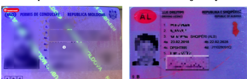
Leedu piirivalve fotod: Täielikult võltsitud Moldova ja Albaania juhiloa