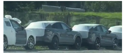
Kinnipeetud Porsche sõiduaudot

Läti tolliametnikud tõkestasid 07.08.2024 avaldatud teatel Rēzekne II piiripunktis 15 uue sõiduauto Porsche ekspordi Kasahstani. Eksporditav veos toodi Läti maanteetranspordiga, edasi oli Porsche sõidukid plaanis vedada raudtee veosena. Läti toll lähtus riskianalüüsi tulemustest ja kahtlusest, et Porsche sõiduautoid ei toimetata tegelikult Kasahstani saajani, vaid need jõuavad Venemaale, mis tõttu ekspordiluba ei antud ning Läti toll takistas nende väljavedu Euroopa Liidust. Venemaale kehtestatud sanktsioonidest vältimise katsete arv 2024. aastal ei ole vähenenud, välja arvatud salaraha väljavõtmise juhtumid. Läti toll tuvastas 2024.aasta 7 kuuga 4814 Venemaale ja Valgevenele kehtestatud sanktsioonide seotud rikkumist (2023.aastal-7789 rikkumist), sealhulgas 1821 juhul tollikontrolli tulemusena takistati sanktsioonide alla kuuluvate kaupade tolliprotseduuride lõpetamist.