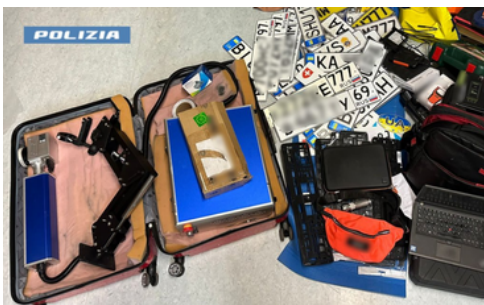
Avastatud seadmed ja sõidukite registreerimisnumbrid

Lisaks konfiskeeriti tahvelarvuteid, sõidukite diagnostikaseadmeid, spetsiifilised laserseadmed metallile kirjutamiseks ja raadiosignaali blokeerijaid Valgevene kodanikud peeti kinni kahtlustatuna rahapesus ja varastatud kaupade käitlemisel.