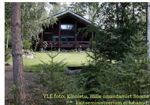
Kinnistu, mille omandamist Soome kaitseministeerium ei lubanud.

Soomes peavad kõik EL või EMP -välistest riikidest pärit Soome kinnisvara ostjad saama selleks loa kaitseministeeriumilt. Samas on pea kõik Venemaa kodanike tehingud Soomes asuva kinnisvaraga saanud kaitseministeeriumilt positiivse otsuse. Näiteks 2022. aastal, kui Venemaa alustas Ukrainas sõda, taotlesid Venemaa kodanikud kaitseministeeriumilt luba 275 kinnisvaratehinguks, nendest 273 kinnitati ning 2024. aasta jaanuarist-juunini menetleti kokku 64 Venemaa kodaniku avaldust. Viimase nelja ja poole aasta jooksul on kaitseministeerium kinnisvaratehingute kohta negatiivse otsuse teinud vaid 10 korral. Soome valitsusele esitatakse 2024.aasta varasügisel läbivaatamiseks eelnõu Venemaa kodanikele Soomes kinnisvaratehingute tegemise täieliku keelustamise kohta. Viimase kinnisvaratehingu blokeeris Soome kaitseminister Sysmä linnas Päijät-Hämees asuvalle kinnistule ja seda ettevõtte Venemaa sidemete tõttu. Tegemist oli Venemaa-Sveitsi äriühime ettevõttega, mis on kantud ka Ukraina sanktsioonide nimekirja. Ettevõtte on spetsialiseerunud satelliitnavigatsiooni vastuvõtjate ja antennide tootmisele ja on osalenud Venemaa riigihangetel. Ostja kaebas kaitseministeeriumi eitava otsuse edasi Soomes halduskohtusse.