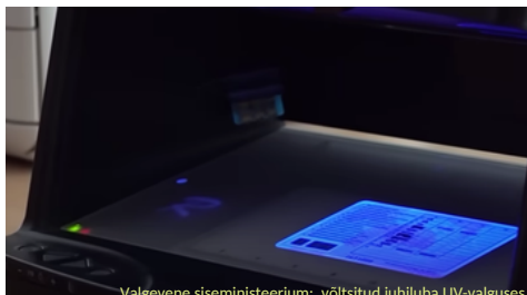
Valgevene siseministeerium: võltsitud juhiluba UV-valguses