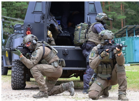
Leedu piirivalve foto 24.07.2024: eriüksuse demonstratsioon

Leedu siseminister Agnė Bilotaitė esitles 24.07.2024 uut ühenderiüksuste konseptsiooni, mis moodustatakse võitlemaks ebakonventsionaalsete hübridiohtudega. Ühendatud eriüksused moodustatakse Leedu piirivalve eriotsustajate osakonna, avaliku julgeoleku teenistuse operatiivvareerimisrühma (ORKA) ja Leedu politsei terrorismivastaste operatsioonide meeskonna "ARAS" operaatoritest.