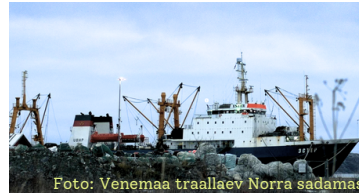
Foto: Venemaa traallaev Norra sadamas

Kommentaari: Venemaa kauba- ja kalalaevastik teostab sarnaselt nagu NSVL aegne tsiviilavastik välisvetes NATO õhusõidukite, sõjalaevade, taristu ning muude objektide osas luure- ja seiretegevust.