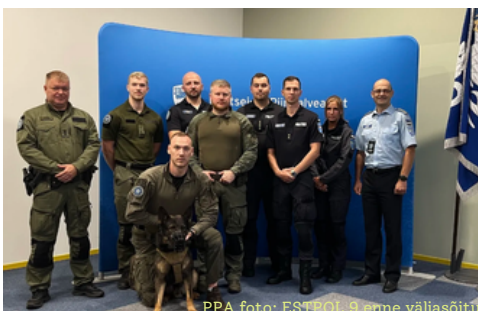
ESTPOL 9 enne väljasõitu

Politsei- ja Piirivalveameti (PPA) lähetas 29.07.2024 11-liikmelise ESTPOL 9 Läti Vabariiki, et toetada Läti piirivalvet tõkestamaks Läti-Valgevene piiril viimasel ajal sagenenud ebaseaduslike sisserännete katseid. Meeskonnal on väljaõpe ja kogemus massiohjekes, meeskond kuulub koerajuht koeraga ning nende varustusse kuuluvad ka dronid. ESTPOL 9 ülesandeks on patrull- ja vaatlustegevuse teostamine koos Läti kolleegidega. Läti-Valgevene piiril registreeriti ja tõkestati alates 01.01-26.06.2024 üle 3 tuhande ebaseadusliku sisserände katse, samal ajal kui Leedu-Valgevene piiril oli veidi üle 350 juhtumit ja Poola-Valgevene piiril üle 21 tuhande juhtumit. Lisaks Eestile toetab Leedu piirivalve Lätti 10-15 liikmelise piirivalvurite meeskonnaga, mille koosseis on koerajuhtid koos koertega ja kriminaalluureametnikud.