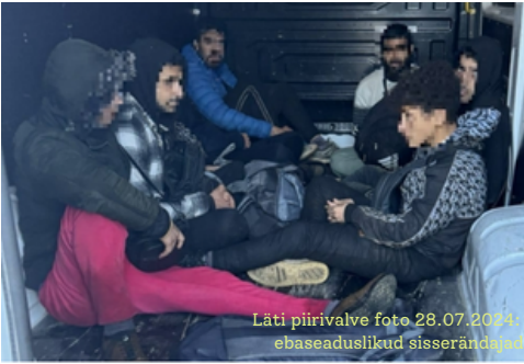
Läti piirivalve foto 28.07.2024: ebaseaduslikud sissekäidajad

Läti piirivalvurid kasutasid 28.07.2024 ebaseaduslike sissekäikude transpordivahendite sõiduki peatamiseks teenistusrelva, mille käigus tulistati kolm lasku õhku. Peale 2 km jälitamist sõiduk peatus ja seda juhtis juhtimisõigustega Läti mittekodanik, kes transportis 8 ilma dokumentideta ebaseadusliku sissekäikudega. Läti piirivalvurid pidasid 25.07.2024 kinni Ukraina kodaniku, kes transportis sõidukis 3 ebaseadusliku sissekäikudega. Sõiduki peatamisel õnnestus ühel iskul põgeneda, sõidukist leiti 2 Aafrika päritoluga isikut