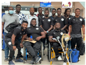
CC foto: Ghana "paraolümpia" meeskond

Norra ametivõimud koos Ghana riikliku paraolümpiakomiteega avalikustasid 21.07.2024, et Schengeni viisadega Norra saabunud 11 Ghana kodanikku, kes kuulusid väidetavalt paraolümpia meeskonda, neist 9 jäid kadunuks kohe kui nad sisenesid Norra territooriumile. Ghana paraolümpia meeskond saabus 25.04.2024 Norra, et valmistada Fjordkraft Bergen linnamaratoniks. Schengeni viisad taotleti ghanalastele väidetavalt võltsitud dokumentide alusel. Meeskonna 2 ülejäänud liikme osas on selgunud, et 1 liige, kes oli väidetavalt koondise treener on nüüdseks surnud, samas 1 liige jäi Norra võimudele piiril vahele, katsetage lahkuda Norrast Rootsi. Ghana kodanikud taotlesid 2023. aastal 45421 korral Schengeni viisat. Neist vaid 23400 taotlust sai positiivse otsuse, samas kui 21226 Schengeni viisataotlust lükati tagasi. Kuigi otsust veel ei ole on tõenäoline, et Ghanast pärit Schengeni viisataotlejate suhtes hakkavad tulevikus kehtima rangemad reeglid.