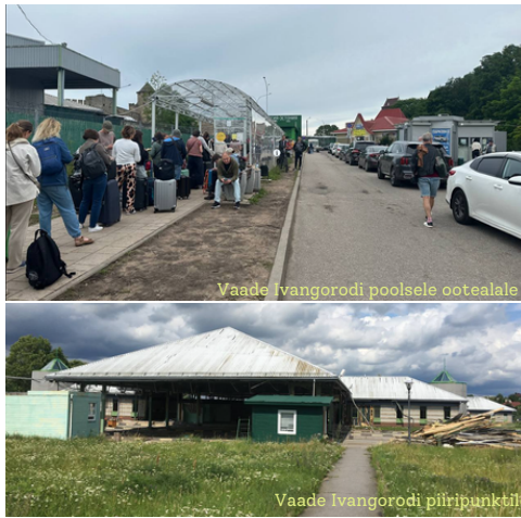
Vaade Ivangorodi poolsele ootealale