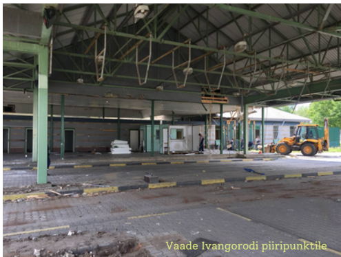
Vaade Ivangorodi piiripunktile

Venemaa Looderingkonna tolli 23.07.2024 teatel jätkub Ivangorodi piiripunkti rekonstrueerimine, mida teostab Venemaa Transpordiministeerium. Piiripunkti territooriumil alustati vanade hoonete ja ruumide demonteerimise ja rekonstrueerimisega. Kingiseppa tolliametnikud töötavad ajutises hoones piiripunkti jalakäijate alal.