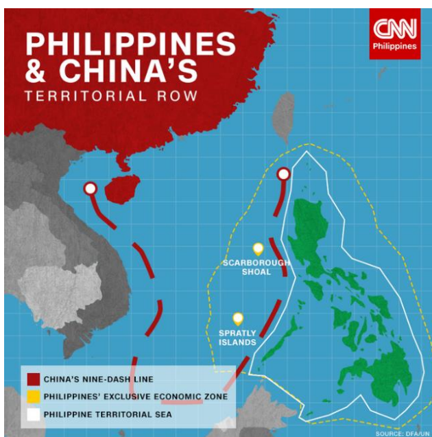
Joonis 2. Hiina territoriaalsed nõudmised Lõuna-Hiina merel (CNN Philippines Staff, 2016)

Ilmekas näide Hiina merehübriidsõjast, mis kätkeb nii õigussõda kui ka kalapaate, pärineb 2012. aastast ja vältab tänini. Nimelt on Hiina enda omaks kuulutanud suure osa Lõuna-Hiina merest „üheksa kriipsu liini“ järgi (inglise k nine-dash line ; vt joonis 2), mis hõlmab hinnanguliselt 62% Lõuna-Hiina merest (Bureau of Oceans and International Environmental and Scientific Affairs, 2014, pp. 3-4; CNN Philippines Staff, 2016; Feng & He, 2021, pp. 9-10). Samas on merealale territoriaalseid nõudmisi ka teistel riikidel regioonis, mille hulgas on Taiwan, Vietnam, Malaisia, Brunei ning Filipiinid (Bureau of Oceans and International Environmental and Scientific Affairs, 2014. p. 13; Feng & He, 2021, pp. 9-10). 1992. aastal võttis Hiina vastu seaduse, millega kuulutas Lõuna-Hiina mere oma siseveteks (Buszynski, 2003, p. 347). Mereõiguse konventsiooni (UNCLOS) artikli 2 järgi on riigil sisevetes võrreldes teiste vöönditega kõige suuremad õigused oma jurisdiktsiooni teostada, sest rannikuriigi suveräänsus laieneb lisaks maismaaterritooriumile ka sisevetele (Ühinenud Rahvaste Organisatsiooni mereõiguse konventsioon, 2005).