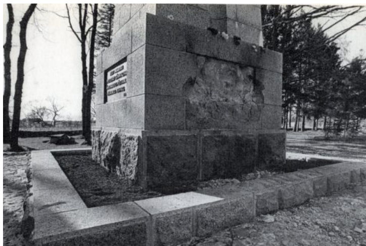
Eesti Vabariigi presidendi Konstantin Pätsi ausammas Tahkurannas, lõhutud 1991. aastal.

Tagajärjed. Lõhkelaeng kiskus lahti pronksbareljeefi Konstantin Pätsi portreega ja paiskas selle kolme meetri kaugusele. Mälestustahvli graniittahvlite killud paiskusid kuni 35 meetri kaugusele. Sammas sai kahjustada, kuid see jäi püsima ja 25. juunil 1991. aastal avati ausammas taas (esimest korda avati ausammas 25. juunil 1939 ning sammas taasavati 25. juunil 1989).