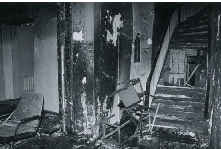
Foto: Plahvatus Eesti Piirikaitseameti ja Kodukaitse majas Tallinnas Toompeal. Henn Karits, Aadu Jõgiaas. Leegitseval piiril: varipiirist ja sidesõjast vabaduseni 1990–1991. Tallinn: Eesti Kodukaitse Ajaloo Selts, 2012

ning palus plahvatuse korraldada kella 21–22 ajal. Slepsov läks seejärel Toompea lähedal asuvasse parki, kus monteeris lõhkeseadeldise kokku, ajastades kellamehhanismi nii, et plahvatus toimuks õhtul kella 21–22 paiku. Seejärel läks ta Toompeale Kodukaitse staabi hoonesse ning asetas lõhkeseadeldise esimesele korrusele sissekäigu lähedal reas asuvate üksteise peale asetatud toolide vahele. (Tammer, 18.08.2000)