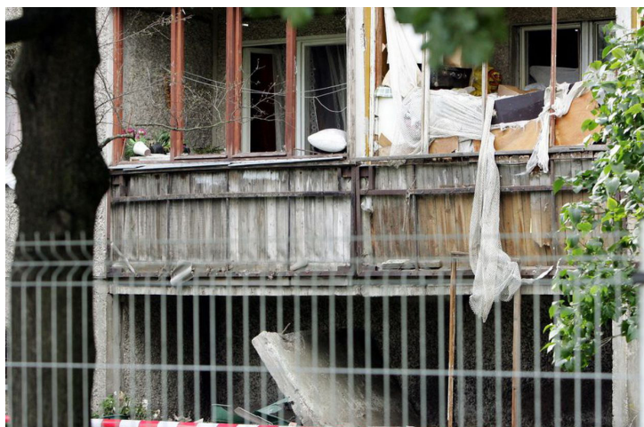
Foto: Plahvatus Pae tänaval, september 2005.