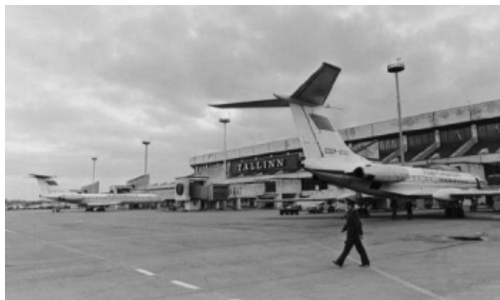
Foto: Tallinna lennujaam, 1981.