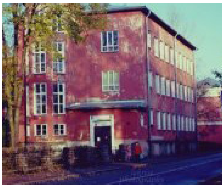
Foto: Narva eesti gümnaasium.