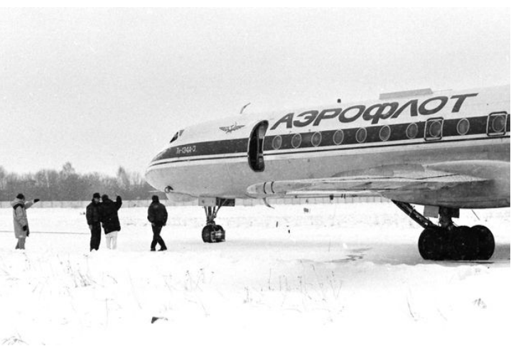
Foto: Kaaperdatud Aerofloti reisilennuk TU-134A Tallinna lennuväljal 20.02.1993.