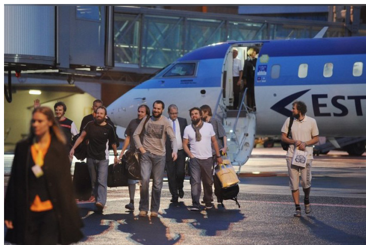
Foto: Estonian Airi erilennuk, pardal Liibanonis röövitud ja ligi neli kuud pantvangis veetnud Eesti jalgratturid, maandus Tallinna lennuväljal 2011. aasta juulis. Allikas: Andres Haabu

30. märtsil 2011 vahistasid Liibanoni julgeolekujõud kolm röövimisega seotud isikut. Järgmisel päeval teatas organisatsioon Taassünni ja Reformi Liikumine (Haraket El Nahda Wal Islah), veebilehele Lebanon Files saadetud kirjas, et turistid on nende käes vangis. Nad esitasid selle tõestuseks kolme röövitu ID-kaardi koopia. Ametivõimude sõnul oli grupi puhul tegemist Liibanoni ja Süüria kodanikest koosneva jõuguga, kes tegeleb salakaubaveo ja muude kuritegelike tegevustega. 6. aprillil 2011. a esitas organisatsioon lunarahanõude, kuid summa suurus jäeti täpsustamata. 20. aprillil laadsid röövijad YouTube'i video (kasutajakonto thekidnaper2011), kus seitse eestlast paluvad abi. Kuu aega hiljem postitati uus video, kus pöörduakse abi saamiseks Liibanoni peaministri, Saudi Araabia kuninga, Jordaania kuninga ja Prantsusmaa presidendi Nicolas Sarkozy poole.